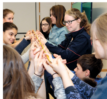
Impression der SSD-Teamleiter-Ausbildung im Februar 2017.

Wenn Du bereits Schulsani bist und nun mehr Verantwortung für die Gruppe in Deiner Schule übernehmen möchtest, dann ist die Grundausbildung für Schulsani-Teamleiter/innen genau das richtige für dich. Hier lernst Du, wie man sinnvoll eine Gruppe leitet, unterstützt und Gruppenstunden aufbaut und gestaltet. Außerdem lernst Du etwas über die Rechte und Pflichten von Schulsani-Teamleitungen, welche Führungsstile es für Dich als Leitung gibt und vieles mehr, was Dir als Teamleitung einer Schulsani-Gruppe hilft. Fühlst Du dich angesprochen? Dann melde Dich für die Grundausbildung am 2. 4. Februar 2018 in Gauting.